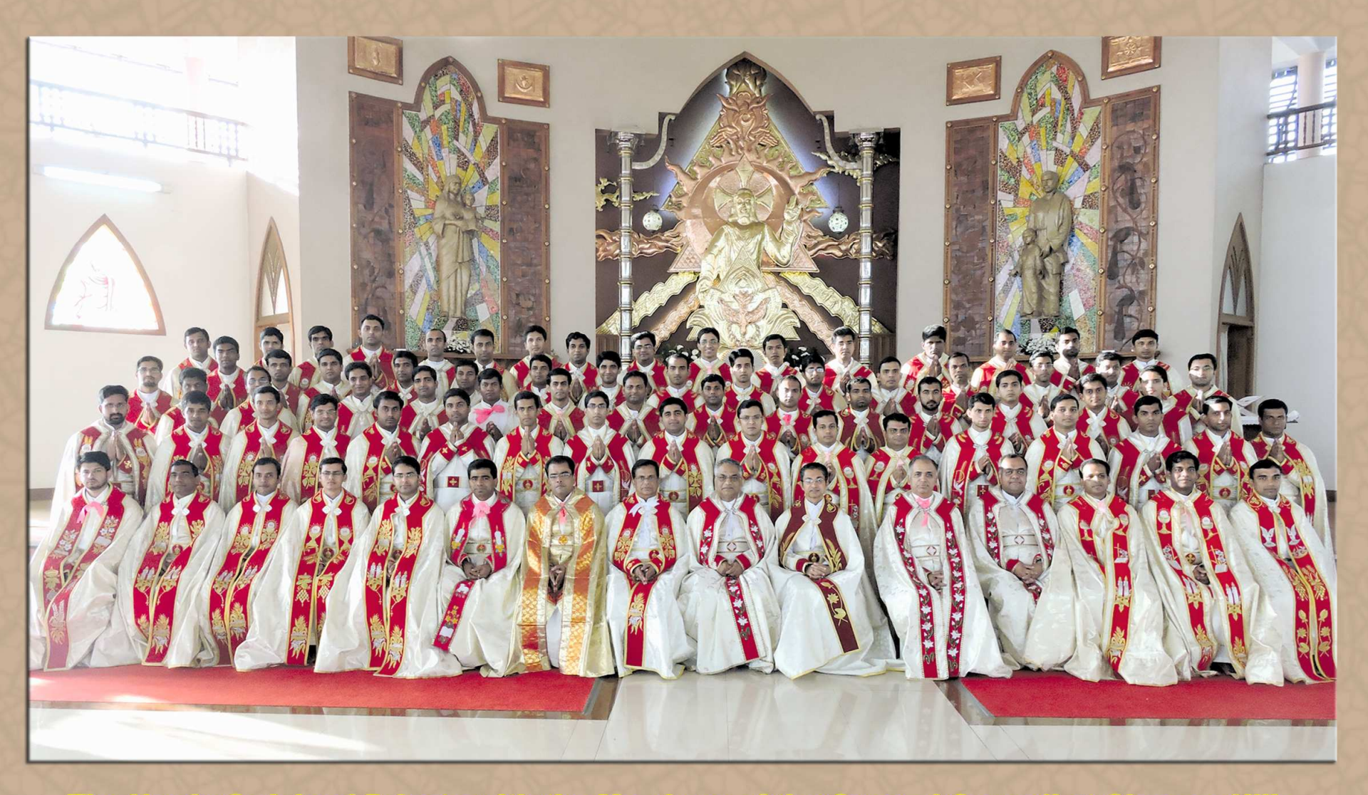
The Newly Ordained Priests with the Members of the General Council at Chavara Hills on 4th January 2015