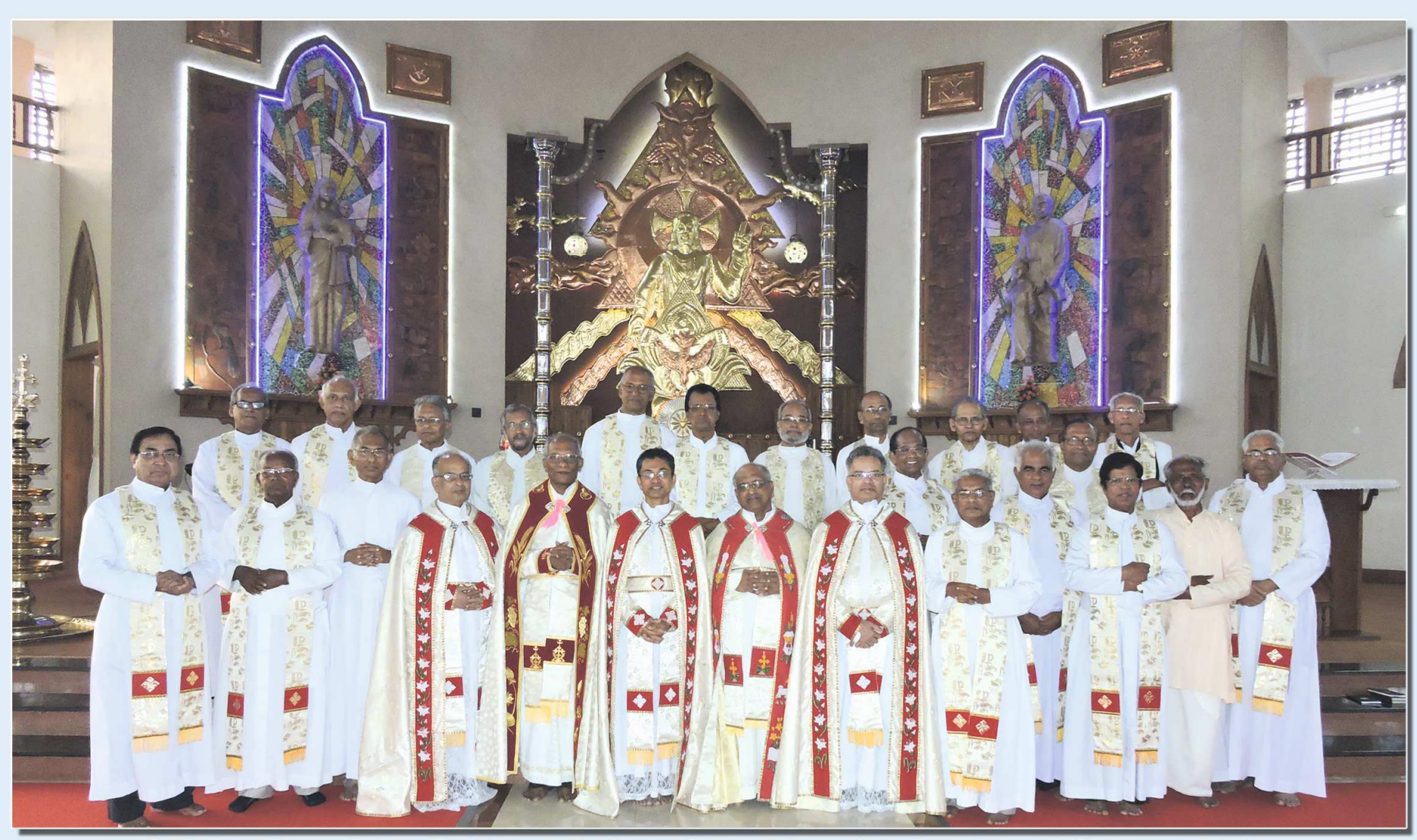
Celebration of the Golden Jubilee of Religious Profession at Chavara Hills on February 4-5, 2015