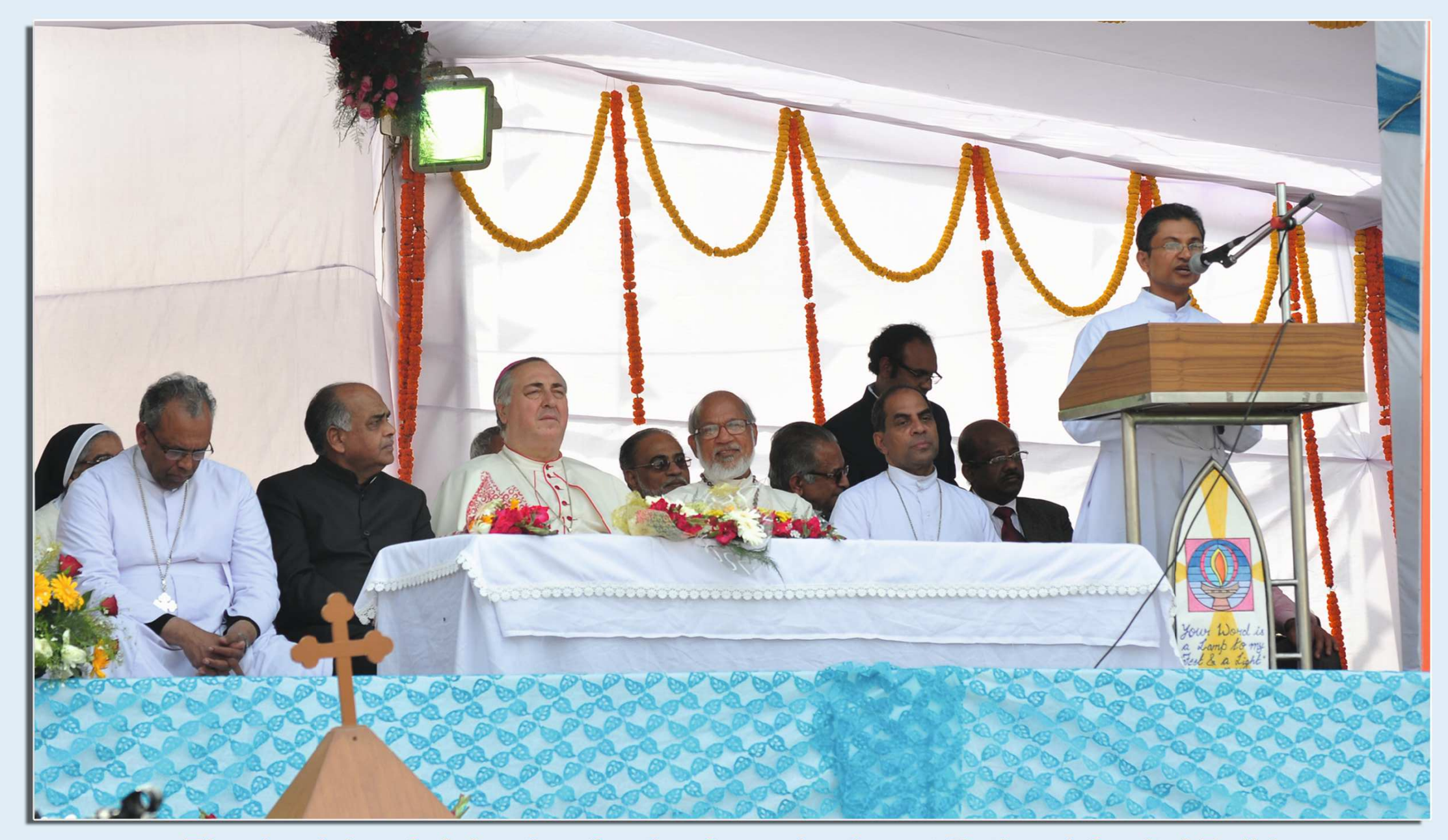
Thanksgiving Celebration for the Canonization at National Capital Delhi February 1, 2015