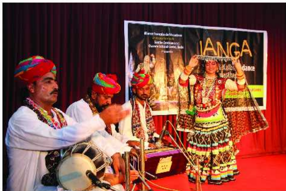
Rajasthani Langa Dance at Chavara Cultural Centre in Association with Alliance Francaise and Goethe Centrum