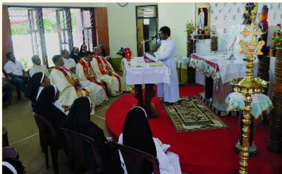
Celebration of 150 years of Chavarul (13/2/1868) inaugurated at Kainakari Chapel on 16/9/2017