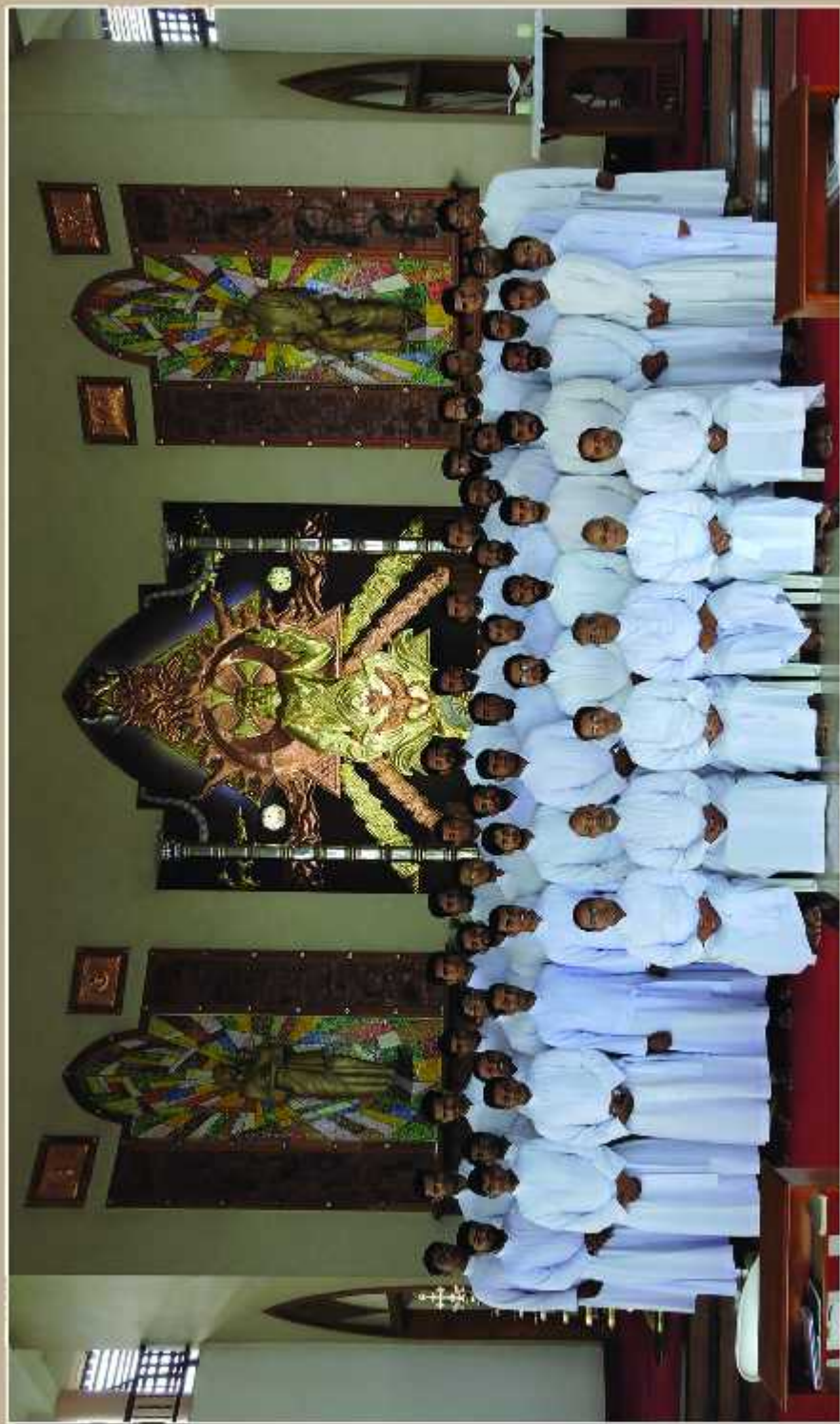
Covenant 2017 - Regents' Meet at Chavara Hills (September 16 - 19)