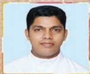
Punnackal Shinto CMI (MUV)