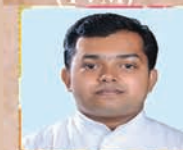
Padinjaredathu Shinto CMI (MUV)