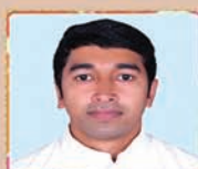
Arayanickal Shinto CMI (KOZ)