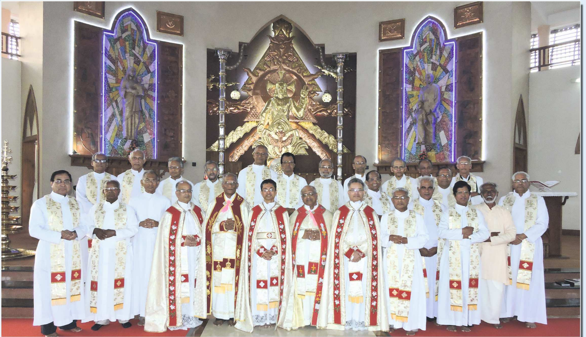
Celebration of the Golden Jubilee of Religious Profession at Chavara Hills on February 4-5, 2015