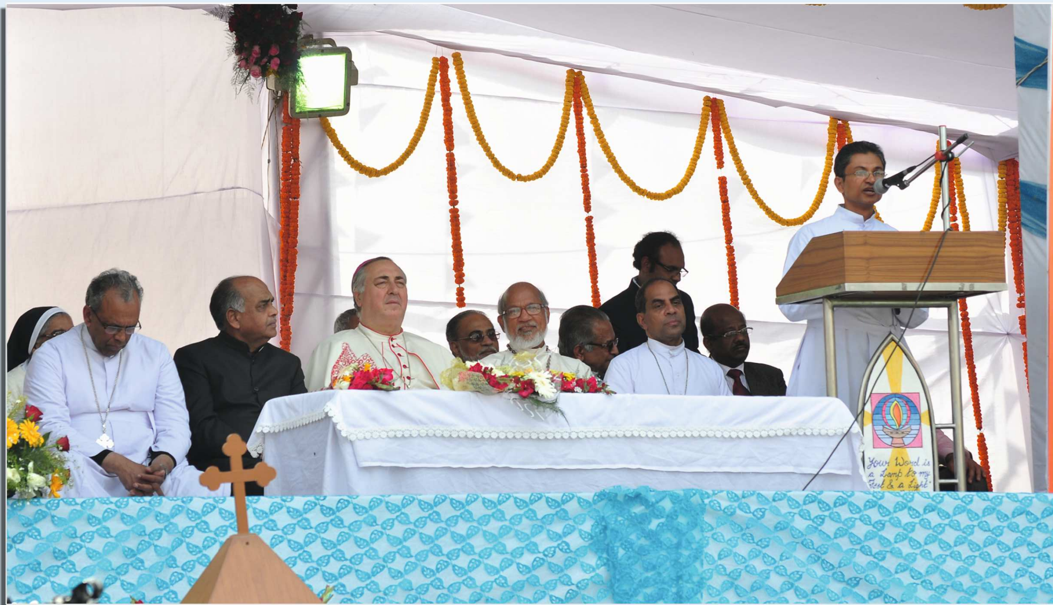
Thanksgiving Celebration for the Canonization at National Capital Delhi February 1, 2015