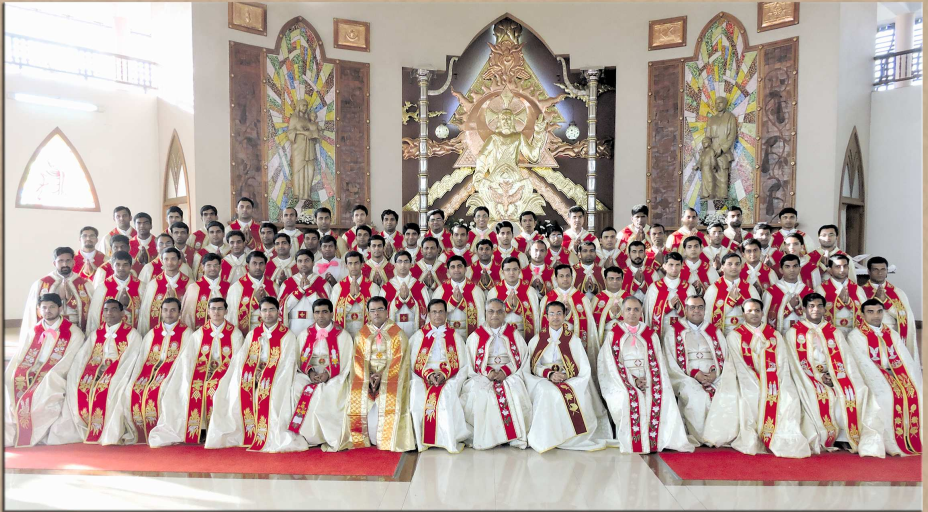
The Newly Ordained Priests with the Members of the General Council at Chavara Hills on 4 th January 2015