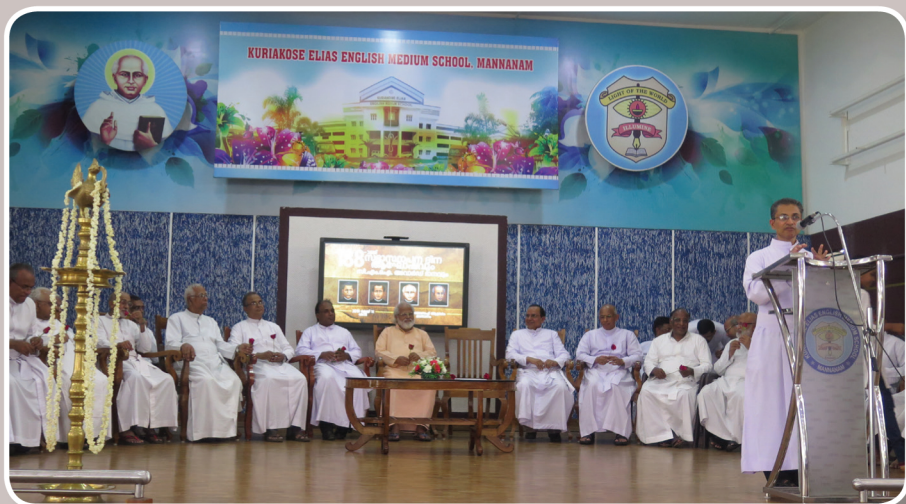
Foundation Day 2019, CMI Awards