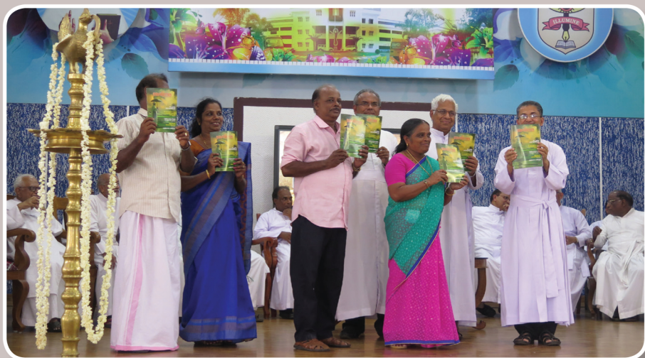
Bezrauma- Release Ceremony