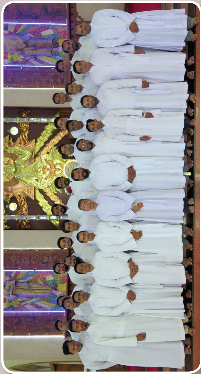
Inservice Training- Aspirants, Rectors, Formation Coordinators, Vocation Promoters, July 20-22, 2019