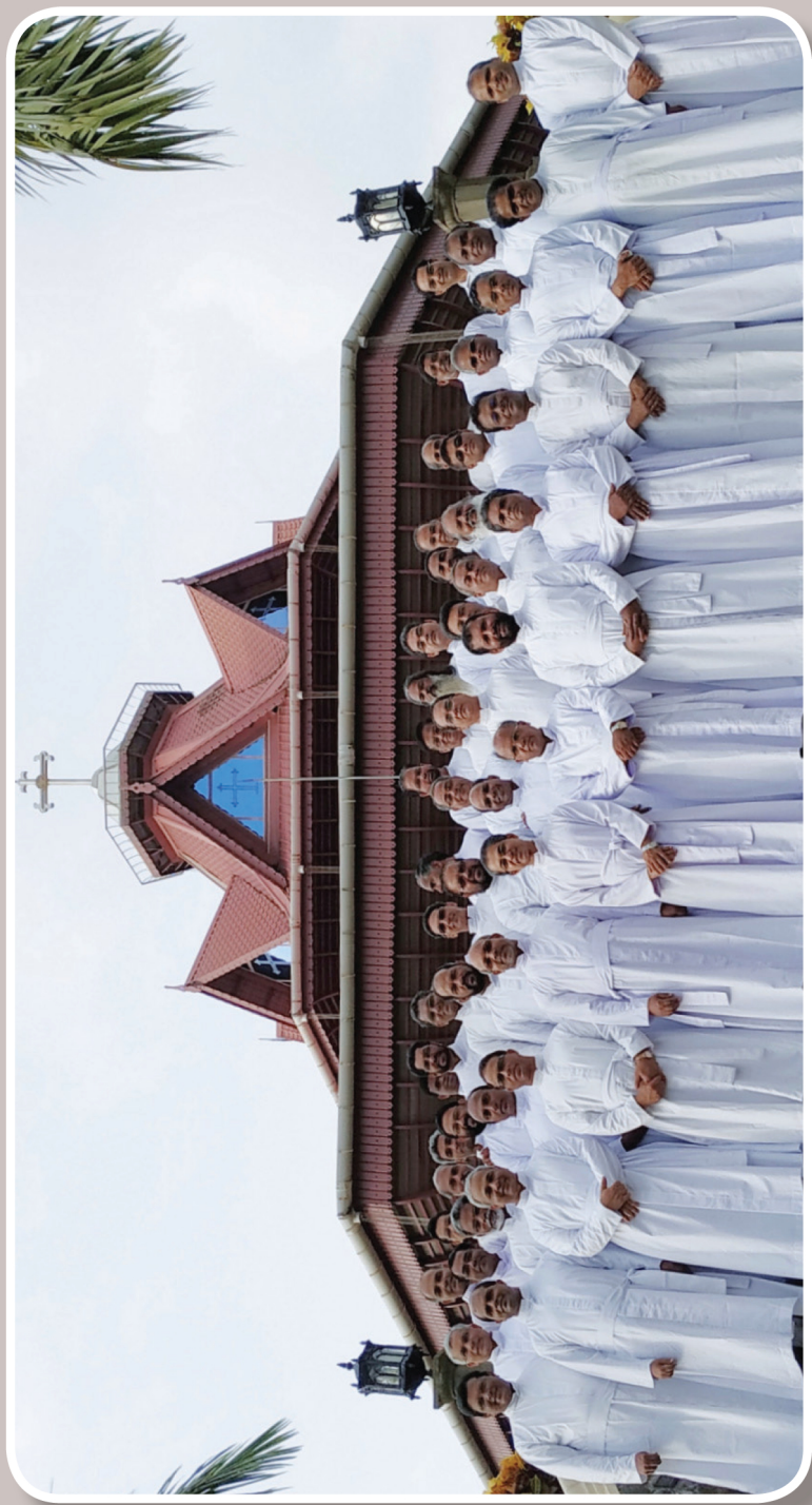
KOINONIA Gathering of Ordination Batch 1991-1995