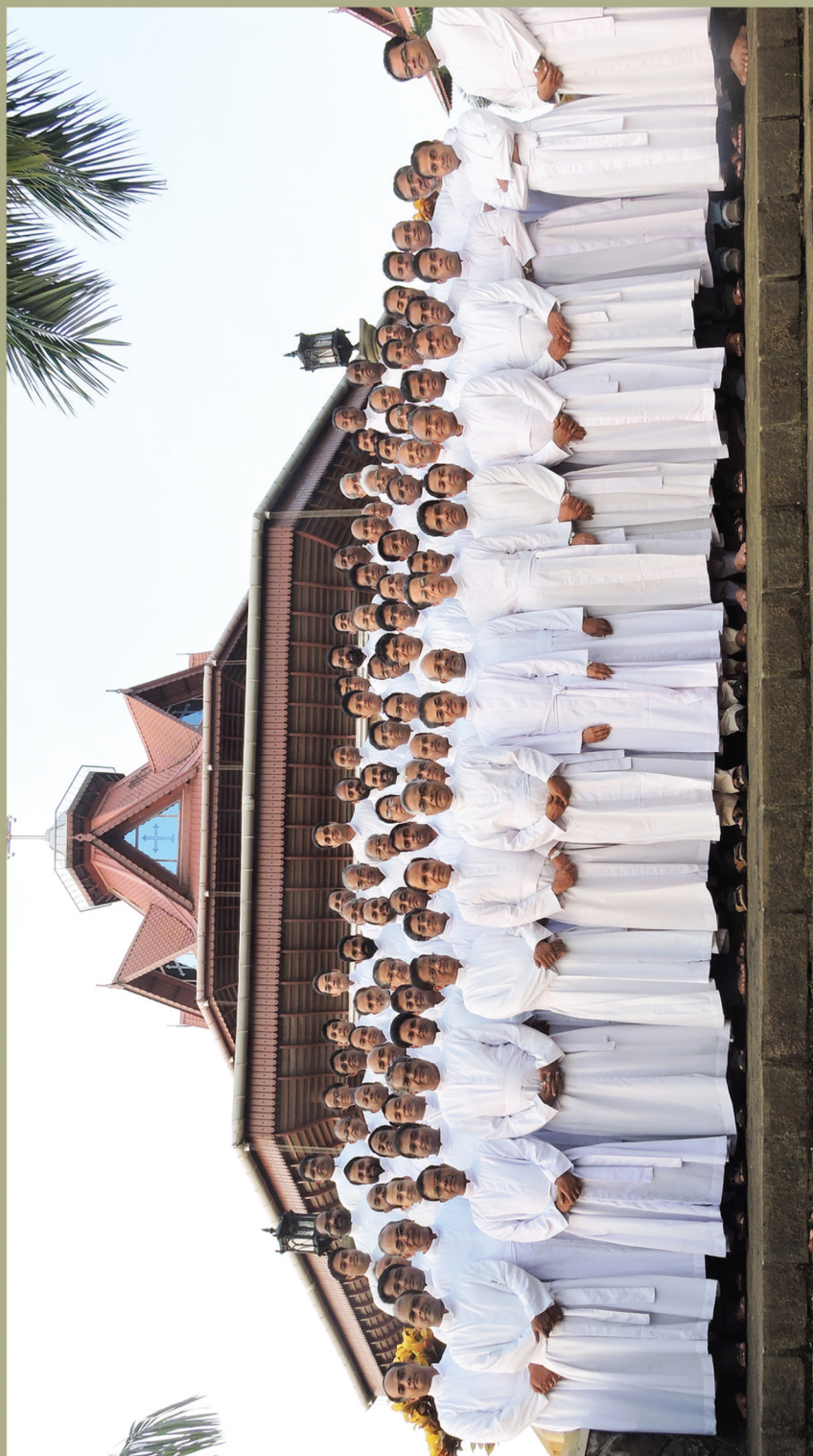
The Newly Elected Provincials and Councillors with Prior General and General Councillors at Chavara Hills for GC-PC 2017